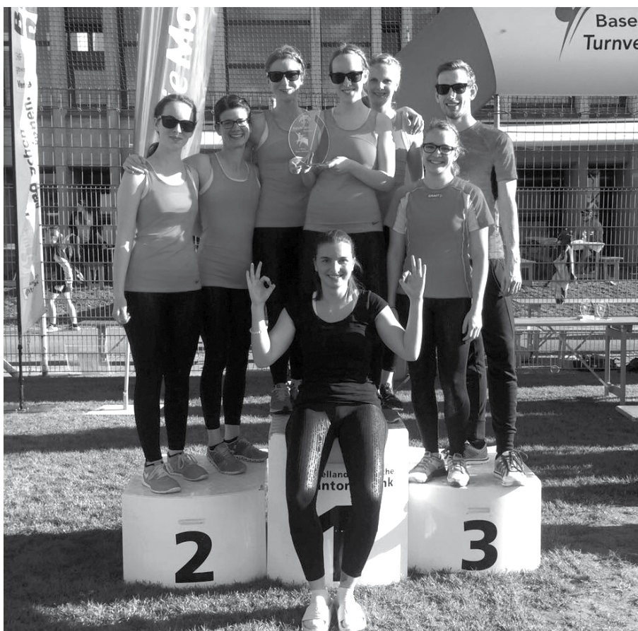
Die frisch gebackenen Kantonalen Meister Team Aerobic! (in Ettingen)