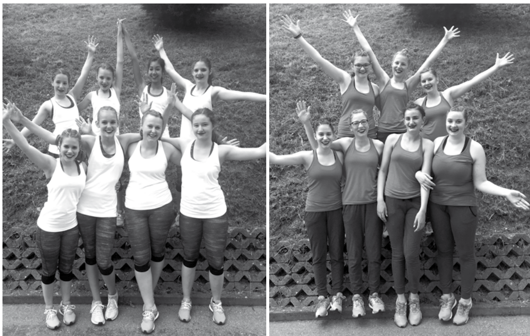
Das Jugend-Team 1 (links) und das Jugend-Team 2 (rechts) am Fricktaler Cup

Die Jugend nahm am Sonntag, 11. Juni am Jugendturnfest in Tecknau an den freien Vorführungen teil. Die beiden Jugendteams zeigten jeweils gekonnt ihre Wettkampfchoreo. Ohne Bewertung, dafür mit genau so grosser Freude! Die Zuschauer belohnten sie mit einem kräftigen Applaus.