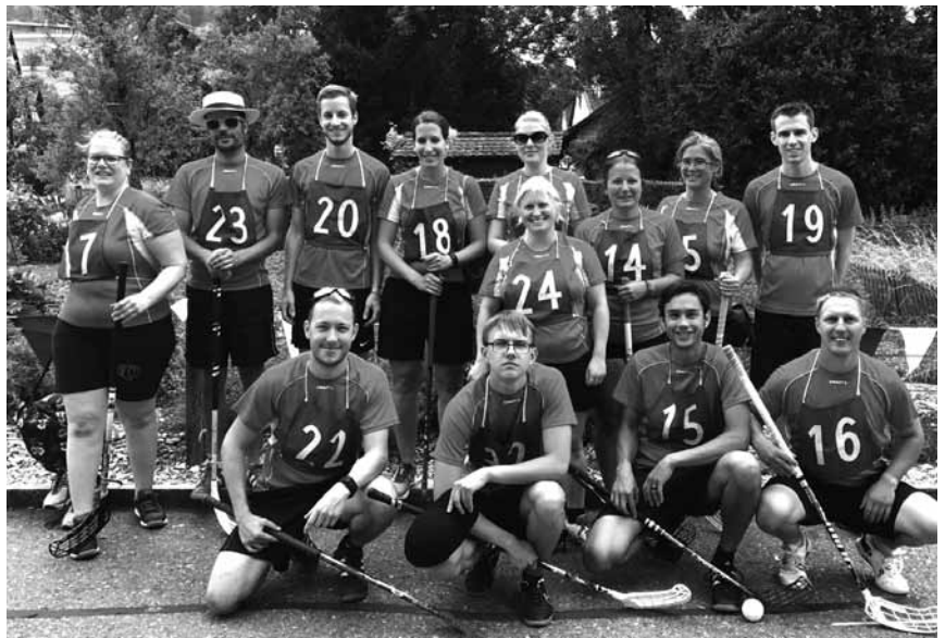
Team Fachtst Unihockey