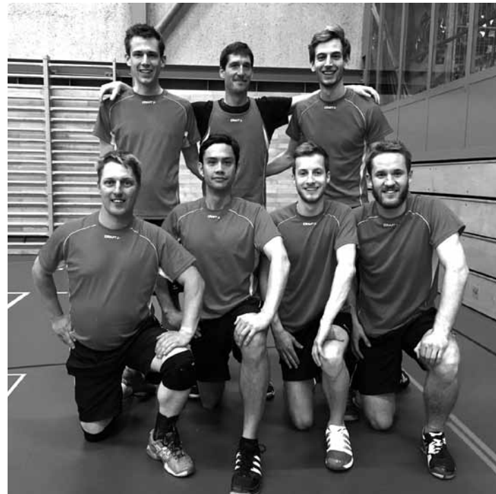
das Team am Volleyballturnier 2017

Sportlich ging es nach dem Turnerabend mit dem Bänklifussballturnier in Zeglingen weiter. Rangmässig ein Turnier zum Vergessen – oder eben um