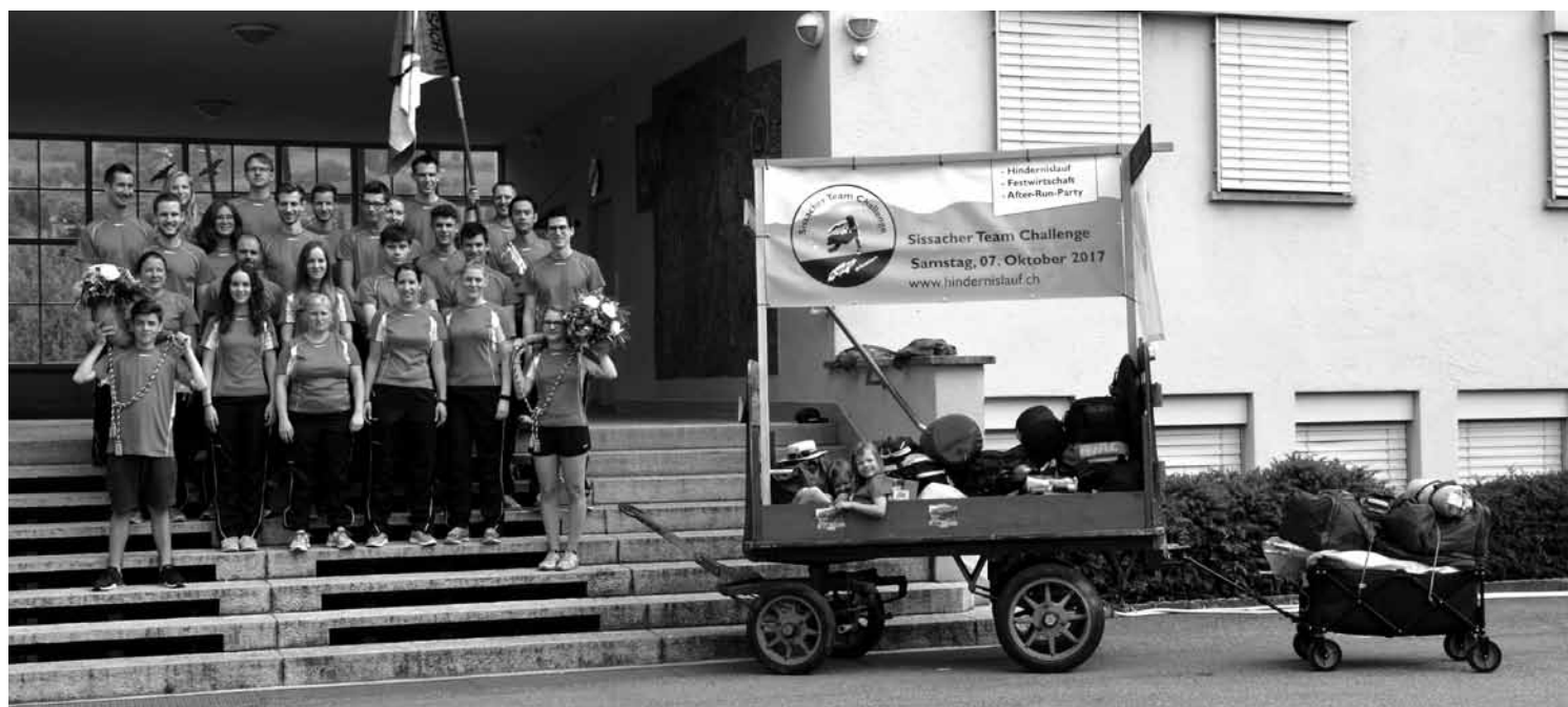
vor dem Abmarsch nach Bökten mit Verstärkung im Wagen

An der darauffolgenden Rangverkündigung durften wir dann erfahren, dass wir den 8. Rang aus 16 Teams