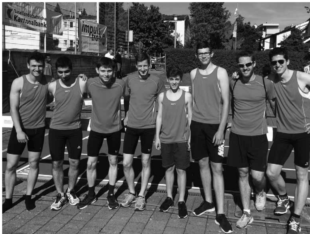
das Team der Pendelstafette an der KMVW 2017

Am Sonntag wartete dann mein eigentlicher Höhepunkt auf uns: Die Rundbahnstafette mit Sissacher Beteiligung. Verletzungsbedingt konnte ich leider nicht mehr mitwirken und das wurmte mich enorm, war ich doch die Person, die uns angemeldet hatte und nun müssen andere ausbaden, was ich organisiert habe. Was mir an dieser Stelle bleibt, ist eine weitere Gratulation auszusprechen, denn dieses Team – mein Team – zeigte eine herausragende Leistung. Die Stimmung unter den Zuschauern rund um die Rundbahn war super und die Läufer zeigten sich von ihrer besten Seite. Auch das ist etwas, wo wir auch in Zukunft noch Potential haben und uns noch weiter nach vorne kämpfen können.