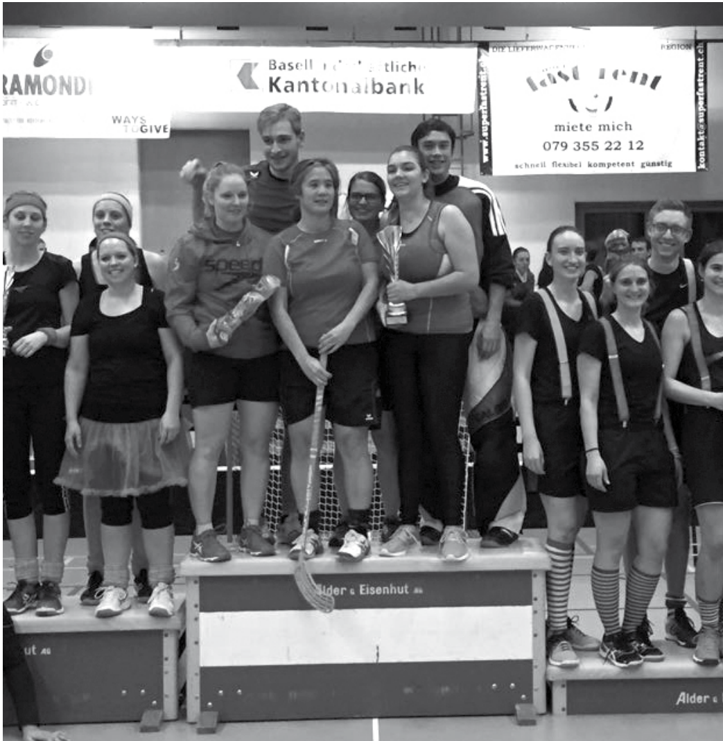
Das Mixed-Team am Chlausencup auf dem Podestplatz Nr. 1

Mit diesem kurzen Bericht wünschen wir euch nun besinnliche Festtage und einen guten Rutsch ins neue Jahr mit hoffentlich vielen sportlichen Höchstleistungen in der Aktivriege. •