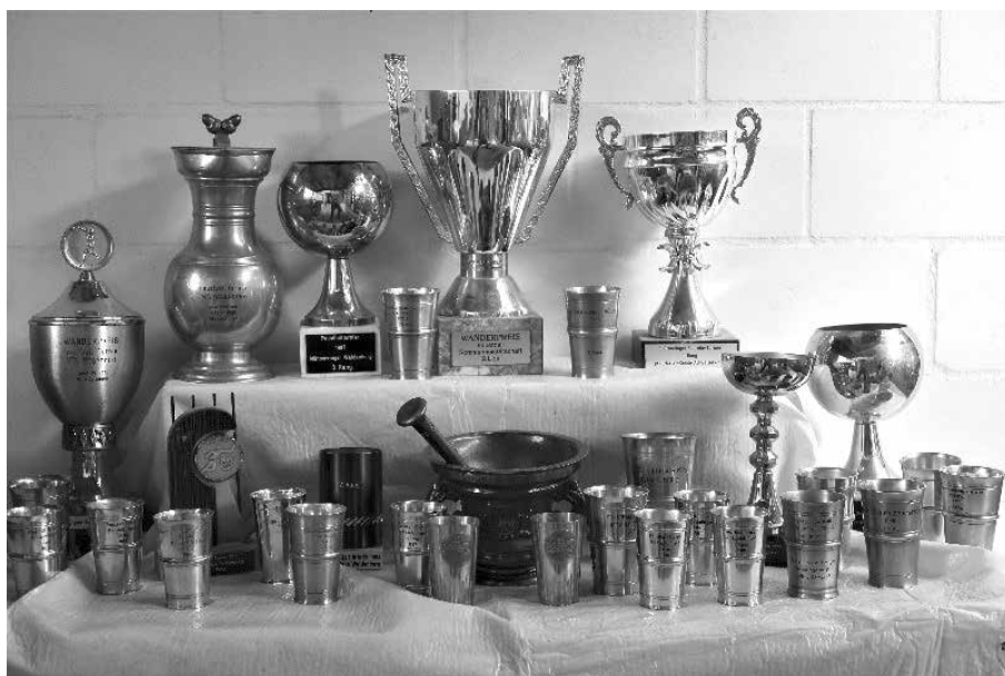
Pokalsammlung vor dem Entsorgen