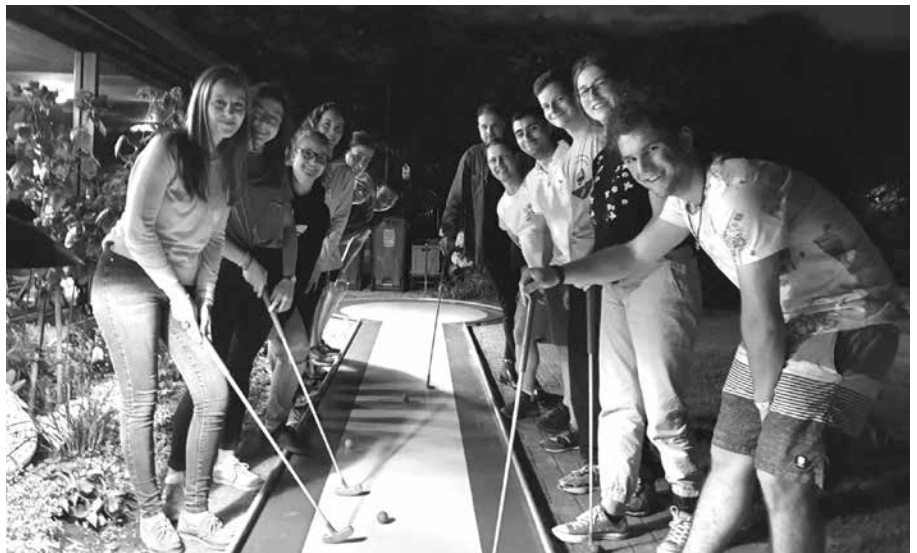
Minigolf in Pratteln