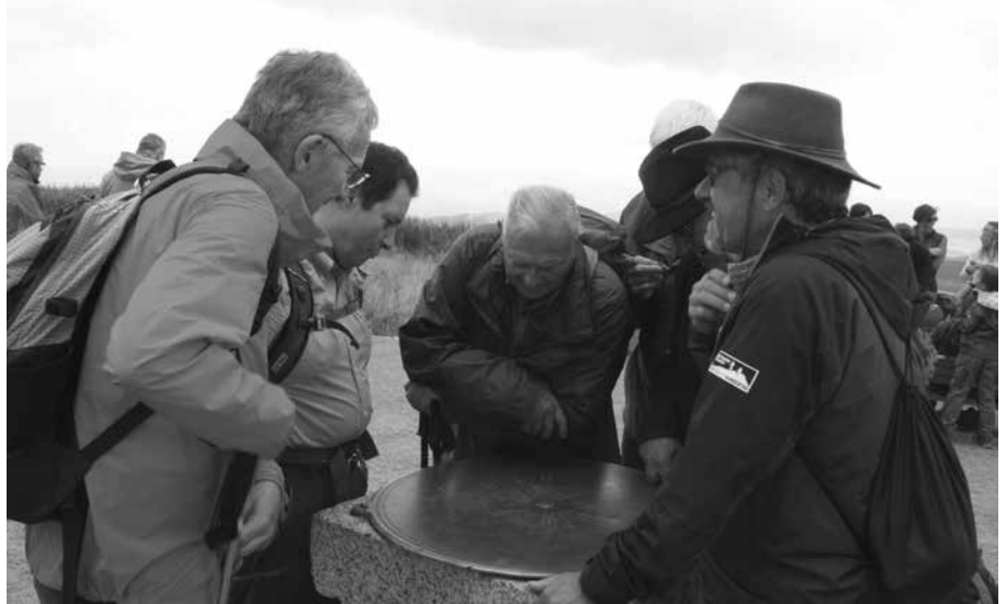
Studium der Berggipfel-Windrose auf dem Feldberg

Der Dauerregen am Sonntag konnte die Stimmung der 28 Mannen nicht trüben. Zum Glück war die Führung im stillgelegten Bergwerk Finstergrund im Trockenen. Und die Wildschwein-Griller im bequemen Sofa des Wiedner Ecks entschädigte den nassen Tag. •