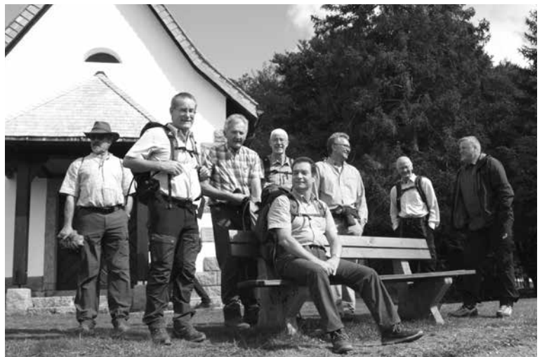
Zwischenhalt bei der Fatima-Kapelle oberhalb Todtnauberg

weitere Bilder: www.tvsissach.ch/maennerriege