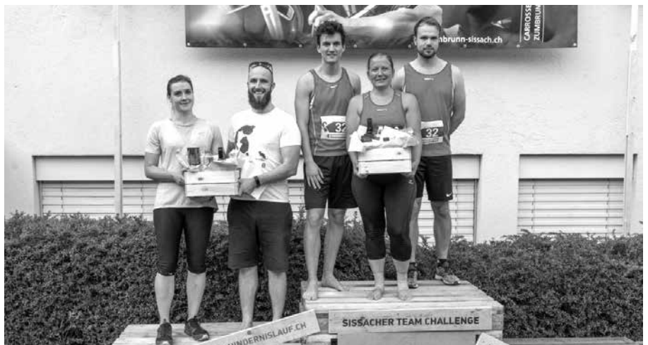
glückliches Mixed-Team am Team Challenge: 1. Rang