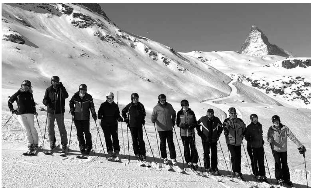
Gruppenbild mit dem „Horu“