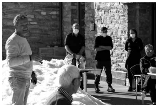
das Hotelpersonal BAG-konform

Skigebietes waren die Schnee- und Pistenverhältnisse immer noch ausgezeichnet. Überhaupt konnten wir in all den 41 Jahren immer an Ostern noch Skifahren. So freuen wir uns auf die 42. Ausgabe im nächsten Jahr wenn es heisst Gornergrat 2022.