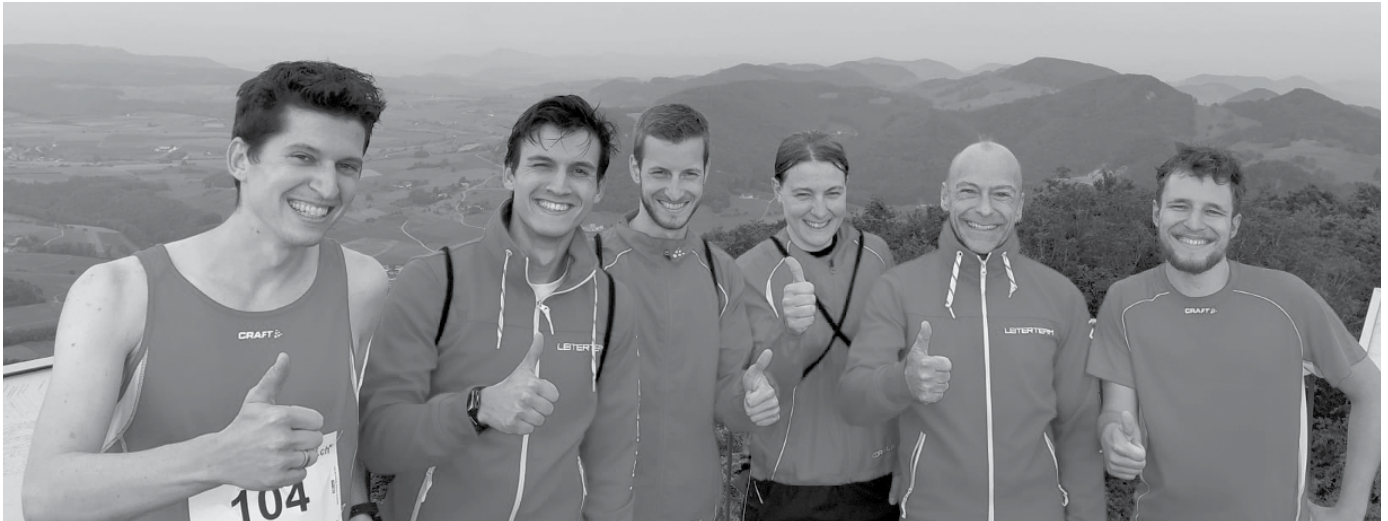
Finisherbild auf dem Wisenberg-Turm

das Sich-gegenseitig-anspornen, das Witzeerzählen, etc. ist genau so wichtig ist wie der sportliche Teil selber.