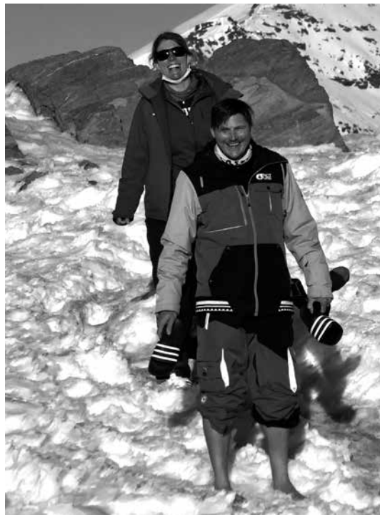
barfuss stärkt das Immunsystem