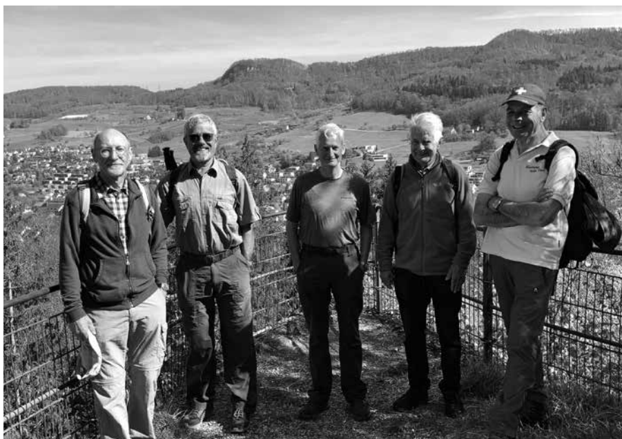
Wanderung vom 27. April Gruppe B