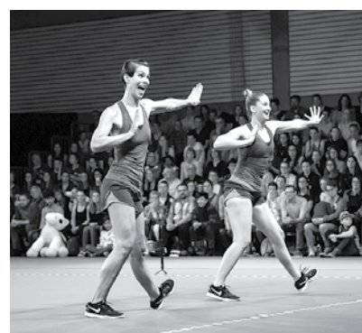
Bilder: Aerobic Schweizer Meisterschaft