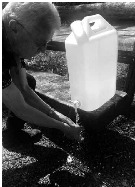
Wanderung vom 27. April Gruppe A

Für viele war dies ein neues Wandergebiet mit tollen Rundsichten. Petrus war uns ein weiteres Mal gut gesinnt.