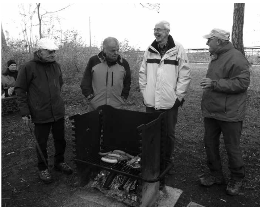
Wanderung vom 13. April