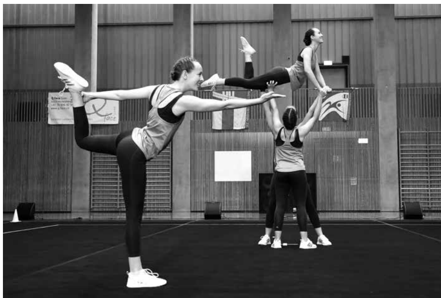
das 4er-Team Aerobic am Zuger-Cup 2023

der Heim-Schweizer Meisterschaften im Oktober 2024. Wir freuen uns riesig auf diesen grossartigen Anlass und hoffentlich auf ganz viele bekannte Gesichter! •