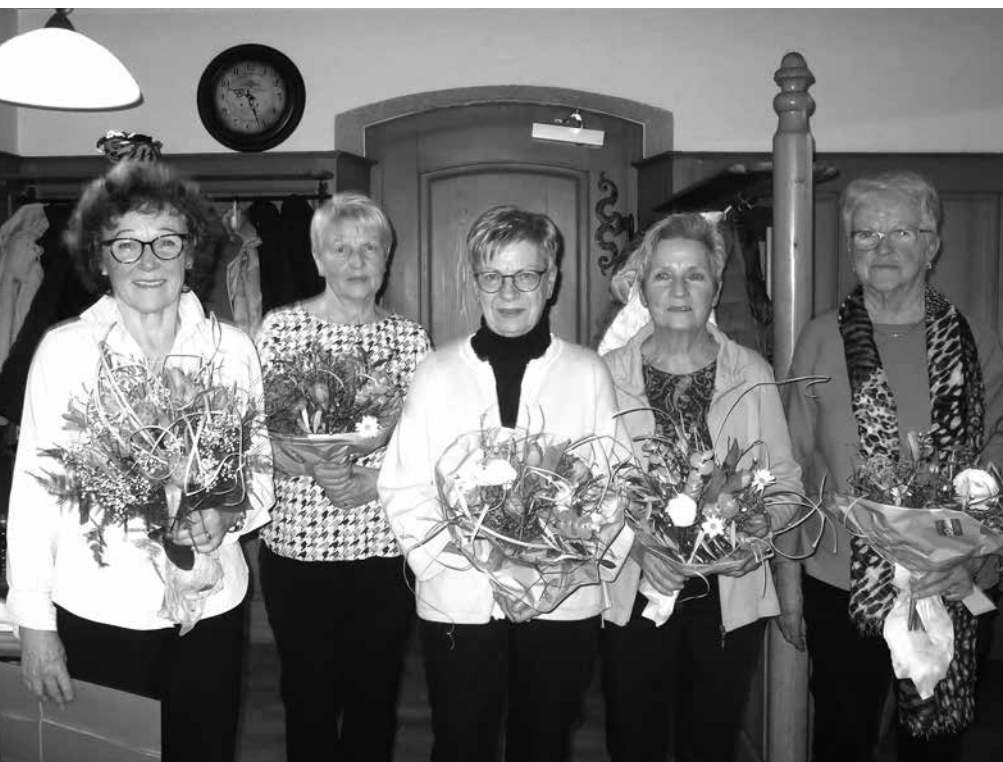
Jubilantinnen für 10, 40 und 50 Jahre Mitgliedschaft