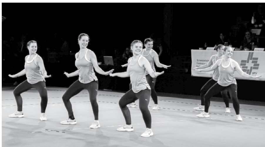
das Aktivteam an den Schweizermeisterschaften Aerobic 2023

Tränen flossen als das Vierer Team am Buechberg Cup die maximale Note 10.00 nach ihrer Vorrunde entgegennahm. Ein weiterer Traum durfte somit in Erfüllung gehen! Sie erturnten sich auch im Finale die magische Note 10.00, standen somit an der Spitze und durften den Buechberg Cup, wie auch bereits in der Austragung im Jahr 2021, gewinnen.